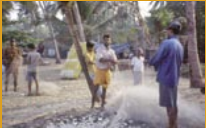
Junge Fischer beim Zusammenlegen der Netze

SAMHATHI ist eine Organisation, die sich für die Entfaltung benachteiligter Gruppierungen, vor allem Fischerfamilien, in Kerala einsetzt. Gemäß der alten Sanskrit-Bedeutung steht SAMHATHI für Solidarität und den Einsatz für einen edlen Zweck.