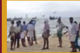
Fischer am Strand von xoxo-xoxox. Der Tsunami hat ihre letzten Fanggründe zerstört

Es ist möglich, eine Projektpartnerschaft anteilig finanziell mitzutragen. Nicht jede Kommune kann die Mittel aufbringen um Projekte komplett zu tragen.