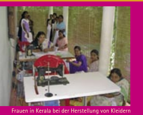
Frauen in Kerala bei der Herstellung von Kleidern

SAMHATHI ist eine Organisation, die sich für die Entfaltung benachteiligter Gruppierungen, vor allem Fischerfamilien, in Kerala einsetzt. Gemäß der alten Sanskrit-Bedeutung steht SAMHATHI für Solidarität und den Einsatz für einen edlen Zweck.