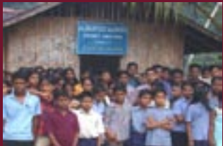
Ein Study-Center und seine Schüler in xxxoxoxo

SAMHATHI ist eine Organisation, die sich für die Entfaltung benachteiligter Gruppierungen, vor allem Fischerfamilien, in Kerala einsetzt. Gemäß der alten Sanskrit-Bedeutung steht SAMHATHI für Solidarität und den Einsatz für einen edlen Zweck.