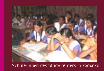
Schülerinnen des StudyCenters in xxxoxoxo